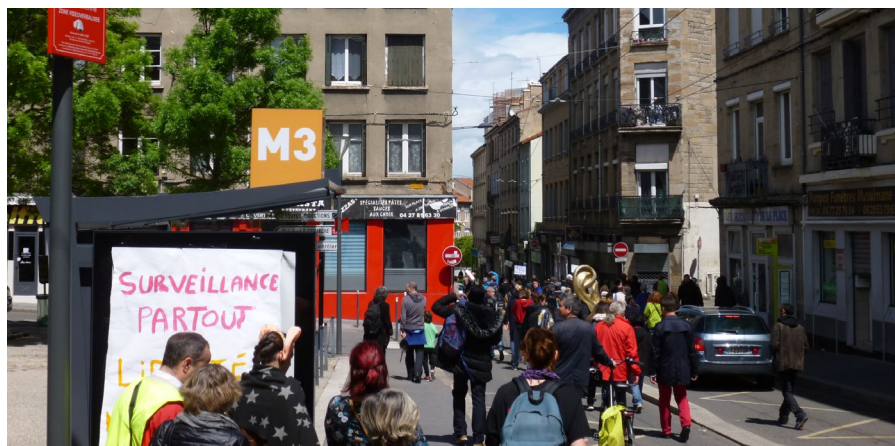
Déambulation festive contre la start up Serenicity dans les rues de Saint-Etienne en mai 2019

En réponse à ce dispositif technopolicier, des collectifs stéphanois se sont mobilisés et ont organisé une déambulation sonore et festive avec percussions et casseroles pour dénoncer ces dérives sécuritaires. Suite à ces mobilisations, aux documents obtenus par demande CADA et à l' avertissement de la CNIL, le projet a été abandonné.